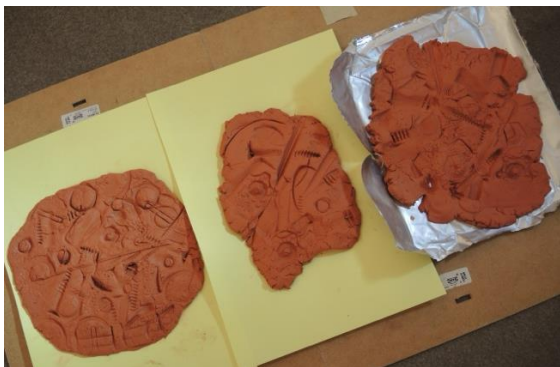
Fotografia 3: Odtlačky dna znečistenej rieky – produkcia žiakov v priestoroch galérie