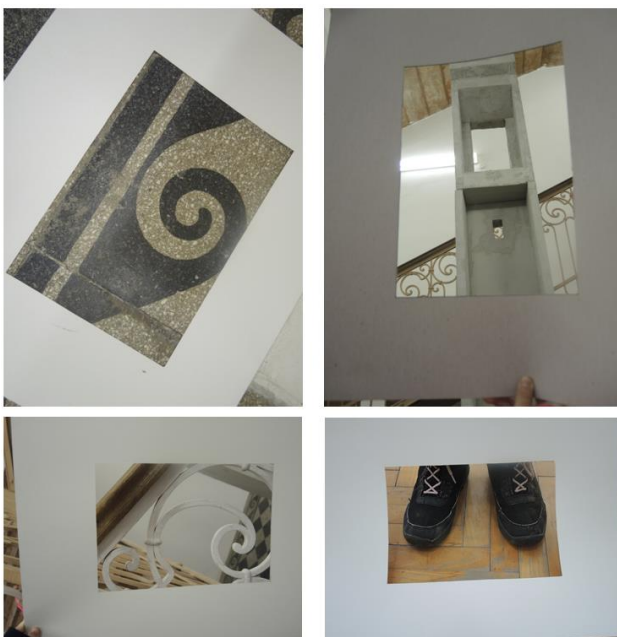
Fotografia 1: Výsledná produkcia žiakov v prostredí galérie

Zahrievacia, úvodná aktivita s hľadáčikom: Ide o jednoduchú vizuálnu hru, ktorej cieľom je žiakov uvoľniť, aby sa nebáli experimentovať a tvorivo využívať možné výtvarné postupy. Každý žiak dostal hľadáčik – kartónový hranatý rám a snažil sa cez neho niečo objaviť a následne zachytiť na fotografiu.