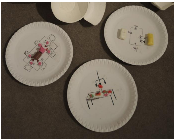
Fotografia 4: Ukážka stolovania – produkcia žiakov v priestoroch galérie

Umelecká intervencia dielom č. 3: Sprostredkovanie diela prebiehalo zaujímavou formou sedenia na stoličkách oproti obrazu a pozorovanie a vytváranie fiktívneho príbehu o tom, čo sa stalo na obraze. Žiaci vedeli identifikovať jednotlivé objekty na obraze ako stôl, postavy a všimli si aj misky, ktoré boli súčasťou expozície a nachádzali sa na zemi. Výtvarná aktivita bola smerovaná k priestorovej tvorbe na papierových tanieroch a tvorivého zobrazenia jedla a stolovania.