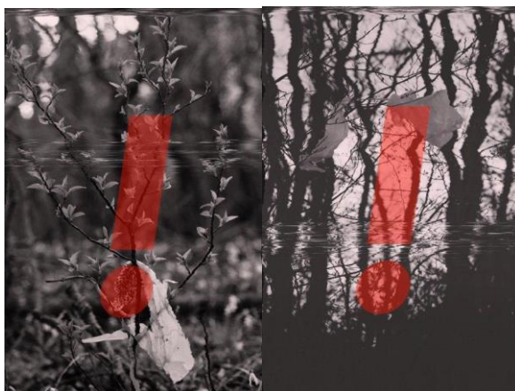
Obr. 4 Parafráza študenta

Študentka si zvolila bezprostredné prostredie svojho bydliska, les, v ktorom často vidí odpad, ktorý do lesa nepatrí. Ako sa prechádzala lesom, postupne nachádzala a dokumentovala prostredie, ktoré reprezentovalo "nečistú prírodu". Tieto fotky rozostrila a pridala efekty rôzneho horizontálneho rozmazania, akoby cez obraz prechádzala páska, ktorá to uzatvára, zakonzervuje, chráni pred okolitým svetom. Výkričník sa stáva