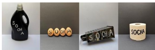
Obr. 6 Parafráza študenta