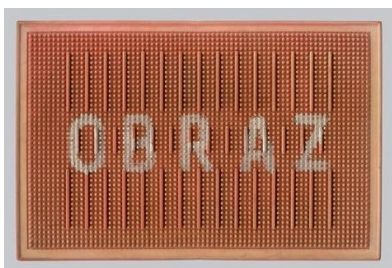
Obr. 5 Július Koller / Obraz (pred dvere)

V parafráze diela, ktorú študentka vytvorila sa rozhodla aspoň na chvíľu povýšiť obyčajné predmety na umelecké diela. Prevzala umelcov koncept a jednoduchosť znázornenia. Prešla sa po vlastnom byte a vybrala štyri objekty – prací prostriedok, toaletný papier, strúhadlo a vajíčka. Proces tvorby bol jednoduchý. Na každý objekt čiernou alebo bielou akrylovou farbou namaľovala nápis „socha“. Nakoniec jednotlivé predmety nafotila na bielom alebo čiernom pozadí a následne spracovala fotografie v počítači. Štyri fotky umiestnila vedľa seba do jedného výsledku, ale objekty môžu byť prezentované aj individuálne.