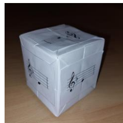
Obr. 2 Vzor notovej kocky a farebnej partitúry