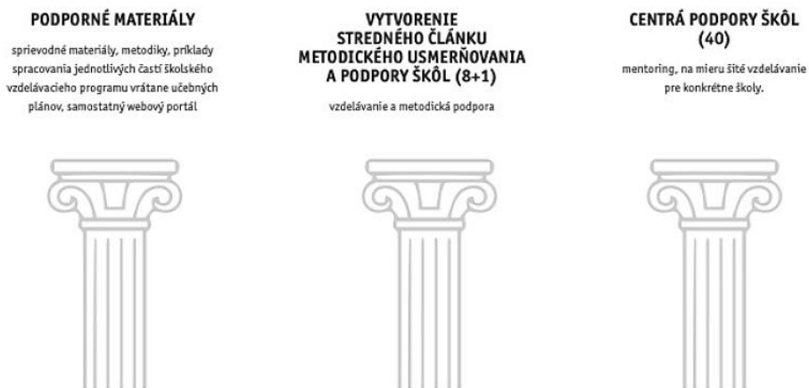
Obrázok 1 Piliere podpory pre učiteľov a školy (Fridrichová, 2022).

Aby sa úspešne transformovalo základné vzdelávanie, je nevyhnutná systematická a cielená podpora pedagogických a odborných pracovníkov, ako aj školského manažmentu. Systém podpory je postavený na troch kľúčových princípoch (obrázok 1):