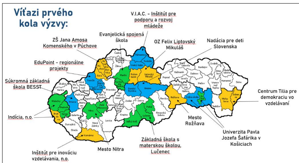
Obrázok 3 Lokalizácia prvých 16 RCPU ( https://www.nds.sk/regionalne-centrum-podpory-ucitelov/ )

RCPU pre okresy Nitra a Zlaté Moravce (RCPU NR a ZM) patrí medzi prvých 16 centier, ktoré začalo svoju činnosť 1. septembra 2022 (obrázok 3) a jeho zriaďovateľom je Mesto Nitra. Svojou činnosťou podporuje 83 základných škôl. Počas prvého roka pôsobenia (september 2022 – jún 2023) v centre pracovalo 11 mentorov, ktorí vykonali celkovo 863 individuálnych stretnutí z toho 333 návštev vyučovacích hodín a 530 osobných konzultácií a mentoringov učiteľov ZŠ z okresov Nitra a Zlaté Moravce. Miera podpory s jednotlivými školami bola rôzna – od intenzívnej celoročnej spolupráce po jednorazovú. Venovali sa celým kolektívom ale aj jednotlivcom. Témy konzultácií a mentoringov sa týkali najčastejšie zlepšenia pedagogických zručností a implementácie inovácií do vyučovacieho procesu, kultúry triedy, sociálnej klímy a managementu správania, spolupráca učiteľ-rodič-žiak či profesijnému rozvoju. V záverečnej spätnej väzbe sa 71% mentees vyjadrilo, že by chcelo v individuálnej podpore pokračovať.