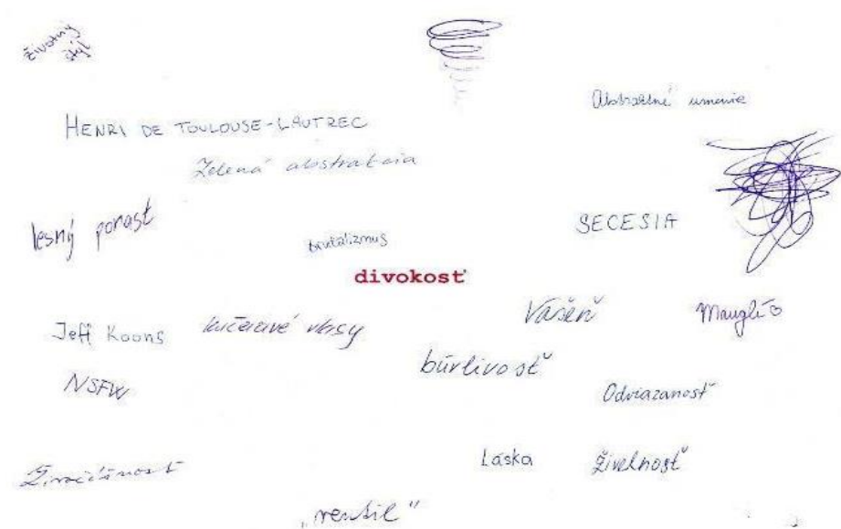
Obr. 8: Postrehy študentov 1. a 2. ročníka KVV PdF UK, ktorí slovné, kresbou spontánne reagovali na slovo, pojem divokosť.

Divokosť (work in process) zakončím slovami Rumiho o hľadani Boha. Hľadal ho márne na križi, navštívil hinduistický chrám aj pagodu. Boh tam nebol. Putoval na návršie Herátu a do nížin Kandaháru, ale nenašiel ho. Ani na mýtickej hore Kaf, dokonca ani v Mekke ho nenašiel. Nakoniec ho predsa objavil. "Pozrel som sa do svojho srdca. Tam vo vnútri, na jeho mieste, som ho uvidel. Nebol nikde inde."