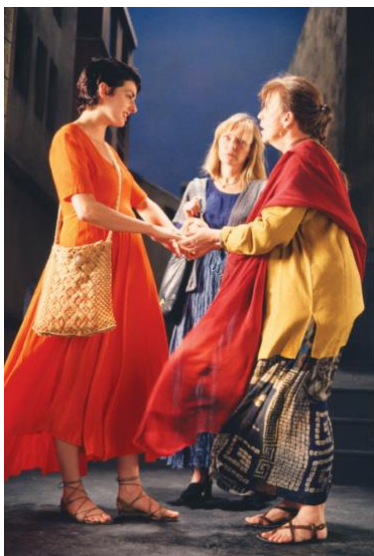
Obr. 6: B. Viola: The Greetings, 1995