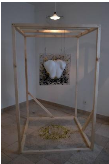
Obr. 5: Medzi nami, 2014, polyesterová živica, prírodniny, sadra, drevo, sklo, voda