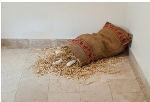
Obr. 4: Autoportrét, 2014, jutové vrece, výšivka, slama, sadra, drôt

Práca Martiny Chudej koncentrovane v sebe nesie odkazy na výtvarné stratégie tvorby ženských autoriek. Jej vlastná téma autoportrétu, ktorý pojednáva v symbolicko-metaforickej rovine, poukazuje na rodové stereotypy vnímania ženského a mužského tela.