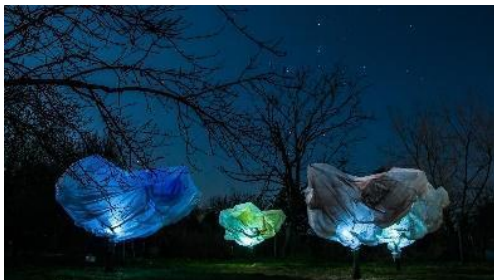
Obr. 2: Spln, 2014, fotografia 4: 11 sec.

Poetická reflexia Kataríny Vigľašovej predstavila citáciu diela od bulharského výtvarníka Christa “Zabalené stromy” (Wrapped trees, 1998), ktoré realizovala formou Land artu a časozbernej fotografie. K dynamike obrazu využila proces tvorby a rozkladu diela, vo výsledku zaznamenané do časozberného videa.