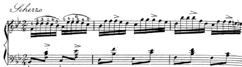
Obr. 3: Vingt Exercices et Préludes , č. 13 B dur.

Marii Szymanowskej neboli cudzie ani humorné polohy, čo dokazuje v Etudách č. 7 a č. 13. Kým Etuda F dur (Scherzando) môže byť podobnou textúrou vhodným doplnkom pri príprave finále populárnej Beethovenovej Sonáty d mol op. 31 č. 3 , hravá Etuda B dur (Scherzo) je vďačnou literatúrou pre osvojenie repetičného princípu, ktorý zdolávali klaviristi s väčšou ľahkosťou na klavíroch viedenského typu.