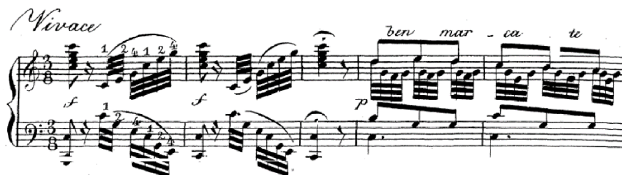
Obr. 5: Vingt Exercices et Préludes, č. 15 C dur.

Prvenstvo najdlhšej časti cyklu patrí Etude č. 15 C dur , ktorá zároveň predstavuje jednu z najľubeznejších skladieb Vingt Exercices et Préludes . I keď na prvý pohľad hlavná inštruktívna úloha spočíva v snahe docieľiť plynosť a kantabilnosť fráz v osminových notách vinúcich sa nad „šumom“ početných dvaatridsatín, hlavný prínos vidím v kultivácii koloristických prostriedkov.