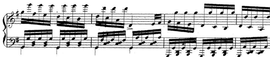
Obr. 4: Vingt Exercices et Préludes , č. 11 G dur.

14. etuda d mol (Risoluto) je naopak prístupná i pre nižšie ročníky. Szymanowska koncipuje part pravej ruky s akcentom na hru legato. Triolový pohyb sprevádza zádrž dlhších hodnôt. Menší diskomfort môže hráč pociťovať v strednom dieli, kde komponistka opäť uvádza prvky ťažšie obsiahnuteľné subtilnejším aparátom (sprievodné figurácie, ornamentácia).