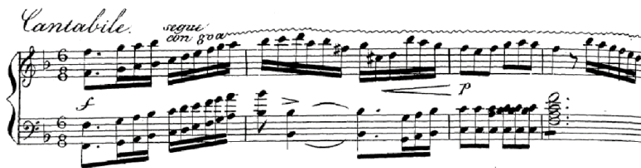
Obr. 6: Vingt Exercices et Préludes č. 20 F dur .

Finále Dvadsiatich cvičení a prelúdií „korunuje“ Première Pianiste de Leurs Majestés les Impératrices de Russie oktávami, ktoré zasadzujú do prostredia relatívne pokľudného tempa s požiadavkou striktného cantabile, a to v rámci celej etudy.