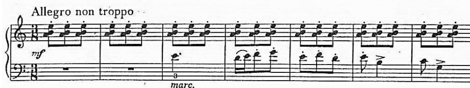
Obr. 1: Milan Novák – Zasneženou krajinou Zdroj: Archív autora