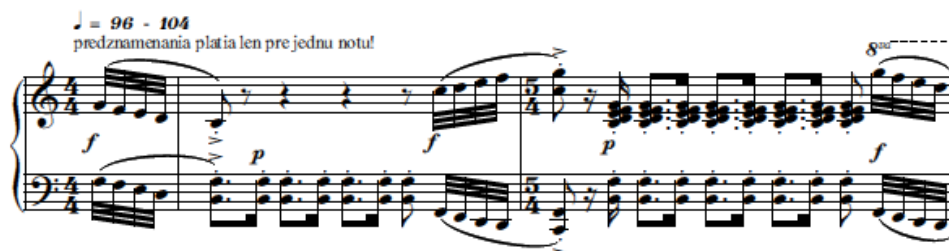
Obr. 5: Martin Jánošík: Na divokom koni