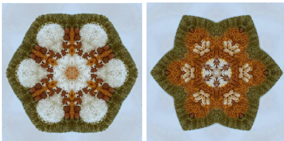
Obr. č. 7 – 8: Tvorba mandaly prostredníctvom grafického programu