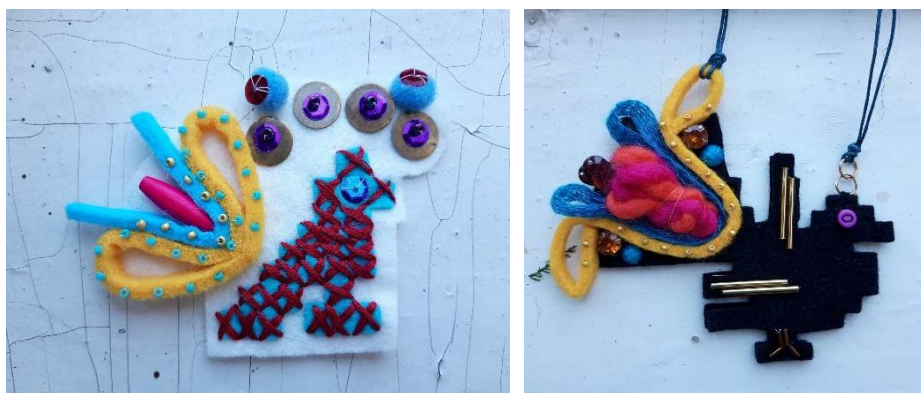
Obr. č. 3 – 4: Preskupovanie vzorov, parafrázovanie vzorov, recyklácia motívu, tvorba nového produktu s motívom vtáka