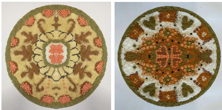
Obr. č. 5 – 6: Tvorba mandaly z prírodnín