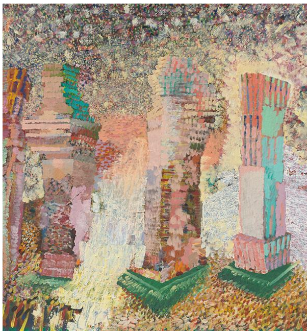
Obr. 4. Berger, J. Stĺpy, olej na plátne, 1990