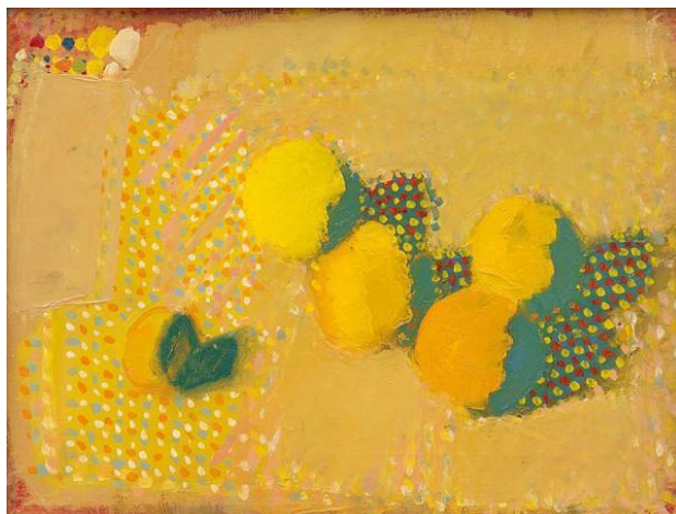
Obr. 2. Hološka, Ľ. Ovocie, olej na plátne, 1973

túto myšlienku: „Nezávislosť netvorí na objednávku, prísne vychádza z vlastnej vnútornej nevyhnutnosti a z vlastnej skúsenosti. Nezúčastňuje sa na rozmnožovaní masovej pakultúry, ale trvá na budovaní kultúry výtvarnej práce (Hološka, 2006).