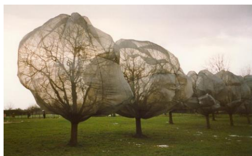
Obr. č. 4 Christo Bolev