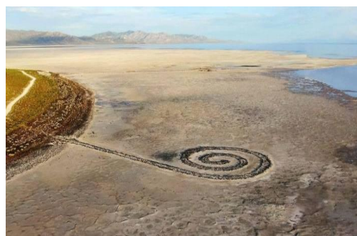
Obr. č. 6 Robert Smithson