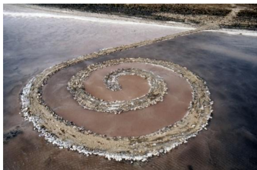
Obr. č. 5 Robert Smithson

hlinu, piesok, štrk, kamene, trávu, zem všetky tieto hmoty sa stávajú umeleckým materiálom. Land artisti premiestňujú, vršia, kopia, akumulujú, kopú, prenášajú z miesta na miesto zem, piesok, hlinu, kamene. Takýmto spôsobom vytvárajú monumentálne diela, ktoré sú z tisícok ton materiálu. Okrem monumentov tvoria aj minimalistické drobné diela, menšie stopy v krajine. Land artoví výtvarníci si často vyberajú špecifické miesta. Napríklad Robert Smithson si vyberal pre svoje diela narušené miesta, aby mohol vytvoriť obnovu, regeneráciu a rekultiváciu prostredia/miesta.