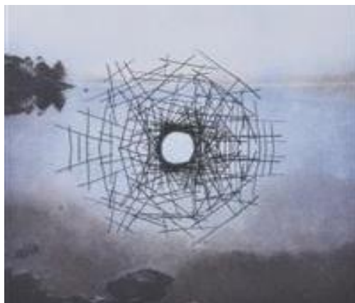
Obr. č. 8 Andy Goldsworthy