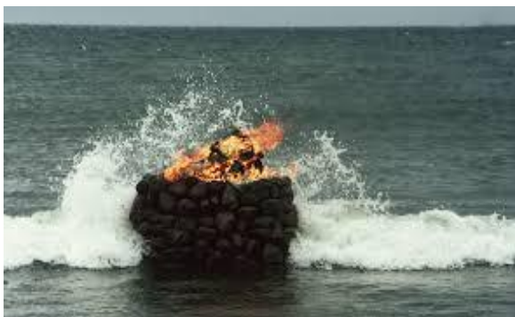
Obr. č. 10 Julie Book