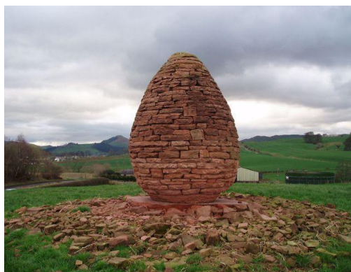
Obr. č. 2 Andy Goldsworthy