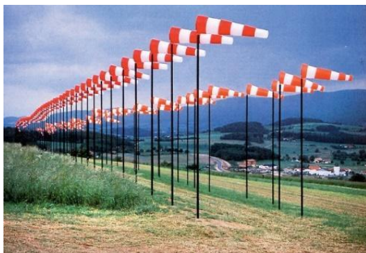
Obr. č. 12 Ivan Kafka